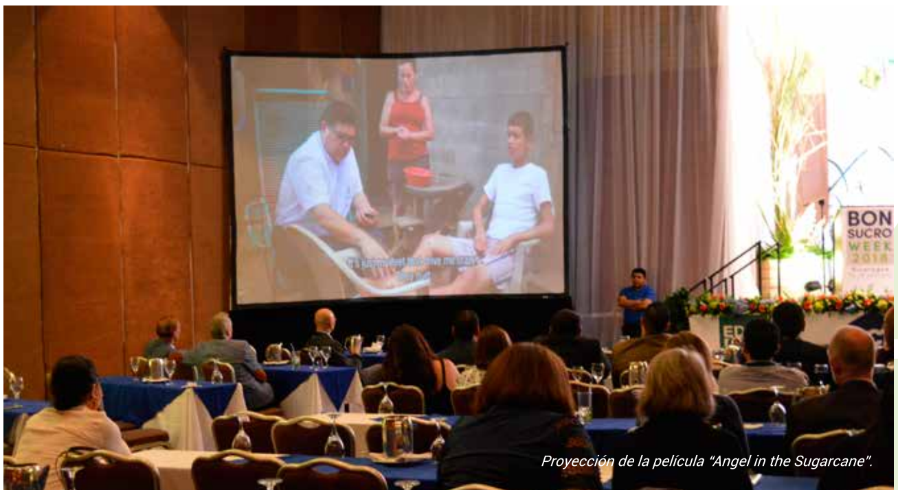
Proyección de la película "Angel in the Sugarcane".

Los participantes compartieron el primer día, un coctel de bienvenida con la presentación de la película "Angel in the Sugarcane", realizada por la Fundación Solidaridad. Este filme relata a través de testimonios, sobre una misteriosa enfermedad que afecta a los cortadores de caña de azúcar en El Salvador, y los cambios de cultura para enfrentarla.